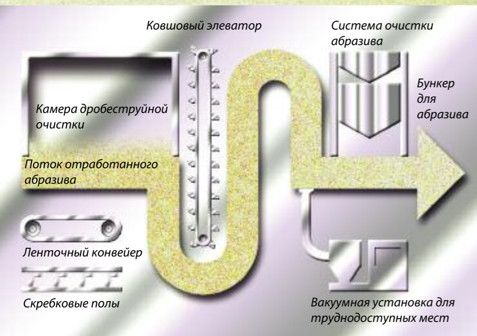
Стационарная система сбора и очистки абразива Munkebo